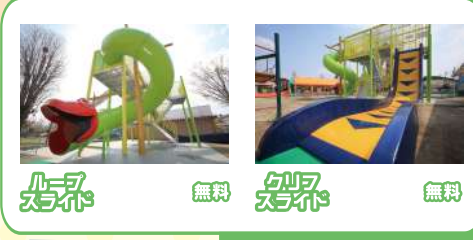
ルーフスライド 無料 クリフスライド 無料