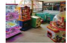
ゲームコーナー 100円~