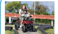
四輪バギー 1周300円 (土日祝) 2周500円