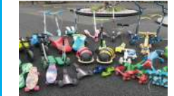
のりものパボコス (土日祝) 30分300円