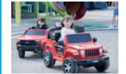
キッズカー 5分300円 (土日祝)