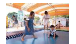
トイポリポリ 5分200円