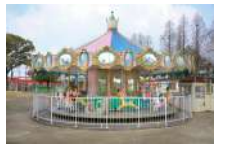
メリーゴーランド 200円