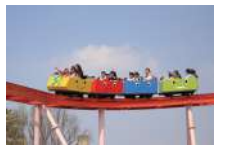
ミニジェットコースター 250円