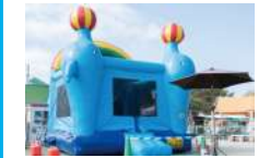
ドルフィンパボコス 5分200円