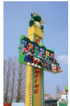
フロッグジモンピング 250円