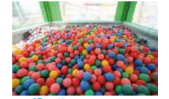
ボールプール 10分200円