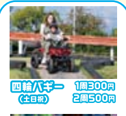
四輪バギー 1周300円 (土日祝) 2周500円