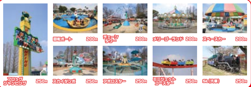
回船ボート 200円 水鉄砲 200円 メロリーランド 200円 スペースカー 200円 ミニジェットコースター 250円 スカーイダンボ 250円 アポロスター 250円 SL(蒸気) 250円