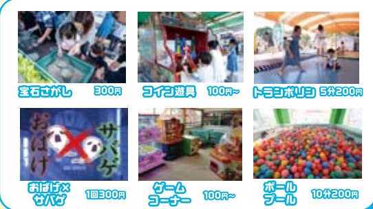
宝石さがし 300円 コイン遊具 100円~ トビゴポリゴ 5分200円 おぼけなサバゲ 1回300円 ゲームコーナー 100円~ ボールゲーム 10分200円